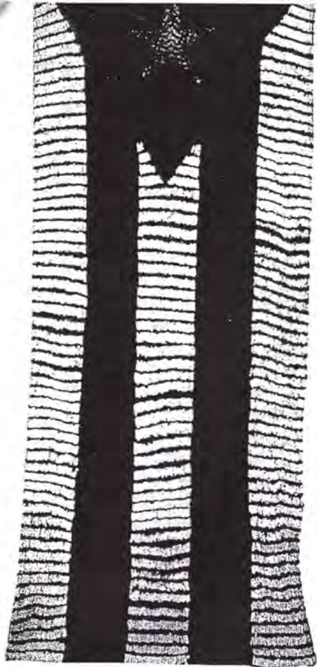
Estadística, 1990-96. Cabello humano, estambre, hilo/tela.